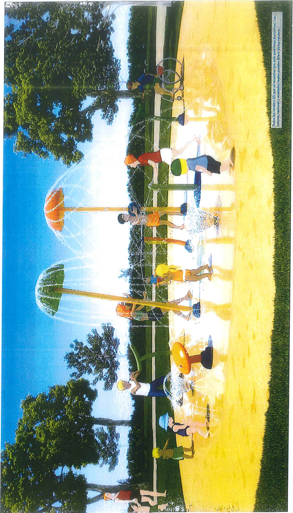
Todos los renders 3D que se muestran son solo para fines ilustrativos. Los colores, texturas y acabados reales pueden diferir de los renders.