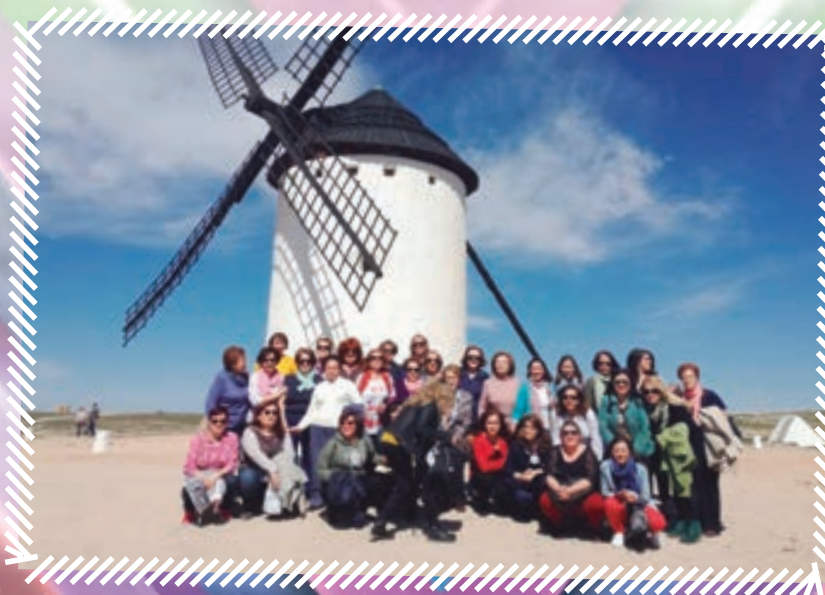
Visita a Campo de Criptana. Día de la Mujer