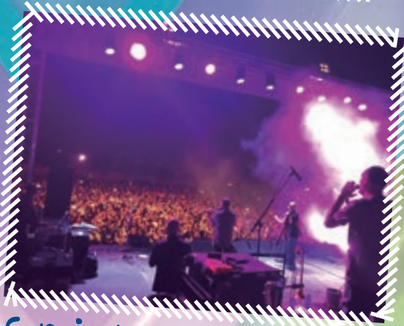
Concierto de Celtas Cortos